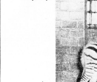
Zur Zeit ist im halleschen Zoo mehrfach Nachwuchs zu sehen; so das erst vierzehntägige alte Zebra, das unser Bild zeigt...