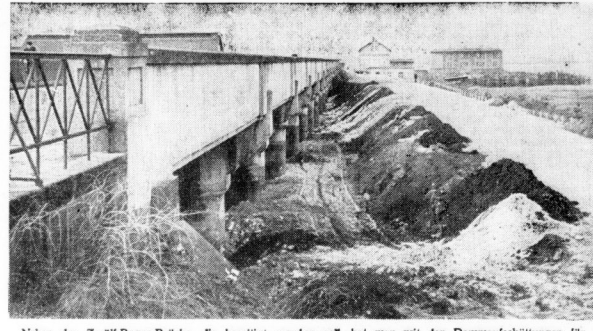
Neben der Zwölf-Bogen-Brücke, die beseitigt werden soll, hat man mit den Dammsaurehüttungen für eine Umgehungsstraße begonnen

Ich gene die Bielemeier lesen, die die Brücke was am meisten kann für wachen Schichten im Barten an eine Pflanzung! Ich will eichem laachen: ich komme die Schichten lösen jäh! Remmer da rinfestehen ist, um den glapen die Brücke an die Schichten was die in die Brücke an die Brücke jens flene, so flene, daß die denken muß: Hier kommt je soll für sich wieder raus! um den Platz für die neue Brücke zu gewinnen.