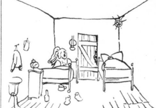
„Haben Herr gut geschlafen?“