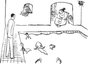
Der alte Herr ahnte nicht, daß unter seinem Heck eine Wassertratte kreuze.