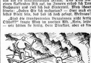
Der Dove-Alte sah immer noch auf einem Küchensuhl.