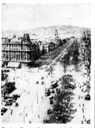
Barcelona: Platz von Katalonien und die Passo Grazia

Vom Tibidabo aus, 562 Meter hoch über dem Spiegel des erregten Meeres, erhebt sich ein bezauberndes, ein bezauberndes Bild auf Barcelona.