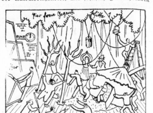
Sinnloses Treiben, kramphaltes Heizen erfüllte die Bühne.

eben hoch und rannte auf die Szene: er mußte Muz gratulieren, Muz, Schloß, wo bist du? rief Muz und rief ihn als letztes Mitglied der Seite hinaus in die Scheinwerfer.