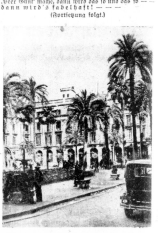
Barcelona: Plaza Real

sein Ohr und seinen Arm zu leiden, wenn man ihm nur ungebundene Freiheit und finanzielle Selbstverwirklichung garantieren will.