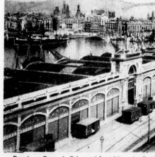
Barcelona: Passo de Colon und Lagerhäuser im Freilhafen

Die träbende Avenida Alfonso XIII. die vom Palacio Real in fast genau westöstlicher Richtung hinabführt bis zur Welle des Pucho Nuevo, münden hinwärt durch die sonderbar rektifizierten Süderböden mit den abgeflachten Ecken, bis zum Meere, da wo die