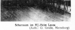
Scharraum im HJ-Heim Leuna

Die festgelegten Jahre der Heimbeschlaffung haben im Gebiet Mitteldeutschland eine lebhafte bauliche Tätigkeit in den Dienst der Jugendzweckung und Jugendpflege auslöst. Verständnis und Zutrauen hat eine ganze Reihe von Gemeinden in Zusammenarbeit mit der Partei und insbesondere der NSDAP an die Errichtung neuer Heime herangezogen. So sind im Januar 1938 insgesamt vierzehn große und kleine Heime fertiggestellt worden, weitere 21 Heime sind zur Zeit in der baulichen Ausführungsphase.