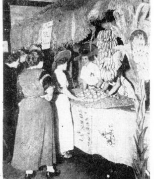
Auf dem gestrigen Kolonialmarkt in Halle konnte man, wie unser Bild zeigt, in nett ausgestatteten Zellen Südfische erwerben (Ausnahme: Danz)