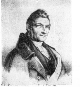
Am 9. Februar 1789, also vor 150 Jahren, wurde Franz Xaver Gabelberger, der Erfinder des nach ihm benannten Kurzschriftsystems, in München geboren. Gabelberger beschäftigte sich schon von Jugend an mit der Zusammenfassung ganzer Teile der Schrift zu einem stenographischen Alphabet, das er im Alter von 29 Jahren vollendete und erstmalig 1819 bei den Verhandlungen der 1. bayerischen Ständeversammlung praktisch ausprobierte. ...