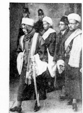
In London eröffnete Ministerpräsident Chamberlain die Palast-Konferenz. Gleich von Anfang an wurden die Schwierigkeiten dadurch offenbar, daß die Konferenz in zwei Abteilungen eröffnet werden mußte, weil die Araber nicht zusammen mit den Juden an der Konferenz teilnehmen wollten. Besonders bemerkt wurde die Yemen-Abordnung wegen ihrer bunten und farbenfrohen Tracht. Im Vordergrund links der Prinz Saif ul-Islam al-Husseini.