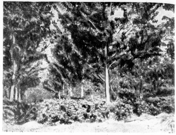
Deutsche Kaffeeplantung mit Schattenbäumen am Kilimandscharo.

Sandhäftigkeit ist Oideani eine afrikanische Perle. Berühmt ist der erlösende Ngorongoro-Sulfan, ein Nachbar des gleichfalls nicht mehr tätigen Oideani-Berges mit einem Krater von mehr als 70 Kilometer Umfang. Die Deutschen am Oideani haben noch lange nicht alles ihnen gehörige Land in Kultur genommen. Wenn erst das ganze Oideanigebiet und alle übrigen für Kaffee fruchtbaren Gebirgsseiten in Ostafrika mit Kaffeebäumen bepflanzt sind, kann ein Viertel bis ein Drittel des deutschen Kaffees bedarfs aus dem jetzigen Wambora-Gebiet Tannanjika gedeckt werden. Vorläufig wird nur ein geringer Bruchteil dieses möglichen Maximums erzeugt,