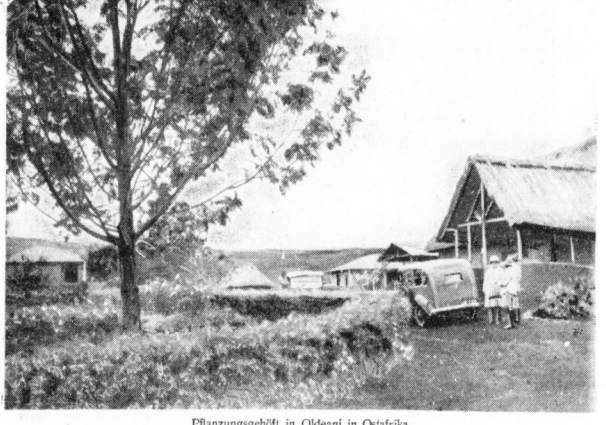
Pflanzungsgebiet in Oideani in Ostafrika.

herhalten Kaffeeplantagen — das es die besten Pflanzungen sind, befragt kaum der Erwähnung — wieder in deutschen Händen.