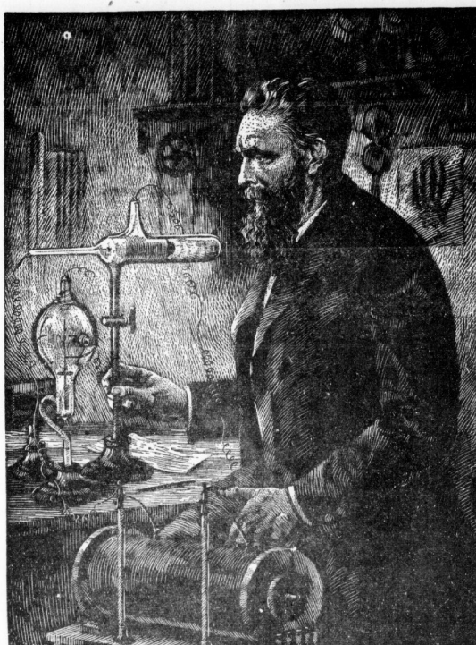
WILHELM CONRAD RÖNTGEN