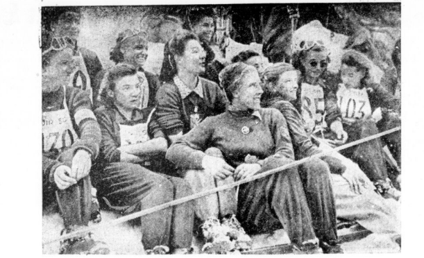
In Luchon-Superbagnères in den Pyrenäen wurden die 28 Skimeisterchen von Frankreich ausgerollt. Bei ihnen die deutsche Weltmeisterin Christl Meisner der Ägypten Kombination wurde. Unser Bild zeigt Christl Meisner als Zuschauerin, umgeben von anderen Teilnehmerinnen, während der Meisterschaften.

Es geht unter dem sünftigen Ägyptologen als ausgemacht, daß im Jahre der Könige, die die Geschichte der Entdeckung des Grabes eine einseitige Werturteilung des Archäologen?