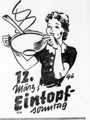
In Leipzig war man sehr zufrieden