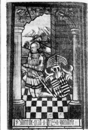
Glasfenster in der St. Annenkirche zu Eisenbach, auf dem Graf Albrecht von Mansfeld dargestellt ist.