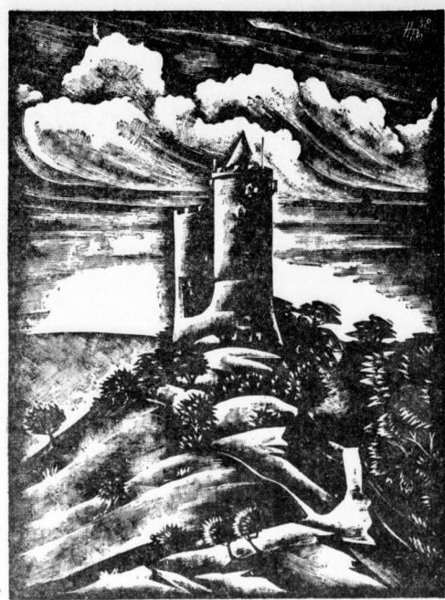
Geistlich von Hannes... ...Saaleburg