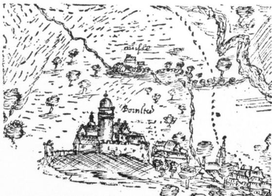
Burg, Gut und Dorf Bornstedt