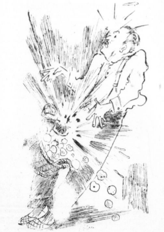
Zeichnung: Eric Zein

Das Einmachglas-Nagel war um den Mai herum immer leer. Es war auch gefüllt leer, als Steinheber hämmerte.