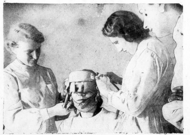
Im Haus der Schönheitspflege in Berlin, über dessen Eröffnung kürzlich berichtet wurde, kann man alle Geheimnisse der modernen Kosmetik erlernen. Praktische Übungen an lebenden Modellen, anatomischer Unterricht, Gesundheits- und Schönheitslehre gehören zum Lehrplan dieser Schule. Die von der DAF veranstalteten Kurse dauern drei Monate und bezwecken mit natürlichen und unschädlichen Mitteln die Menschen möglichst lange jugendgesund und leistungsfähig zu erhalten. — Unser Bild: Eine elektrisch gezogene Gesichtsmaschine bewirkt eine starke Erwärmung einzelner Gesichtspartien und somit eine bessere Durchblutung.

Die bulgarische Kammer hat einen Versicherungsbescheid angenommen, wonach in Zukunft das Vermögen von Junggefallen nach ihrem Tode dem Staat anfallt. Junggefallen können über ihren Nachlaß nicht mehr testamentarisch verfügen. Gleichzeitig wurden für Junggefallen über 25 Jahre Steuererhebungen von 20 bis 30 Prozent beschlossen. Schließlich erhalten Junggefallen über 25 Jahre weder staatliche noch kommunale Anteile.