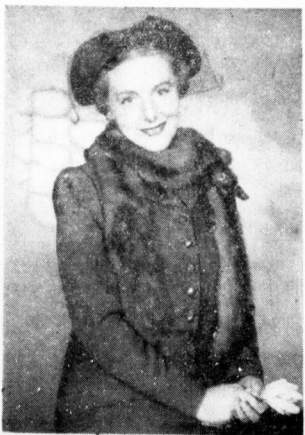
Henry Porten wieder im Film Eine Darstellerin, die die Zeit nicht anhaben konnte - so begegnet uns Henry Porten jetzt in dem neuen Film 'War es der in freien Stock?'