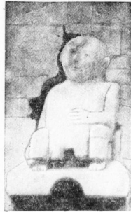
Der „Haingot“ in einer Wand der Neuenburg; wahrscheinlich das Bild des einarmigen germanischen Gottes ER (THUR)

Unter dem obigen Titel erscheint demnächst im Verlag der Hallischen Nachrichten ein Führer für Radwanderer. Es wird damit einem offenkundigen Bedürfnis und oft reaktiver Wunsch vieler Volksgenossen entsprochen. Denn wenn drüben zum Wochenende oder zur Ferienzeit nicht hinaus aus den Mauern in die grüne, blühende Weite; welcher Radfahrer möchte die Schönheiten und Reize seiner engeren und weiteren Heimat nicht im Sattel seines getreuen Fahrzeuges erleben! Doch wohin? Ist es immer die große Frage. Schon mancher Radfahrer fuhr beherscht ins Blaue und geriet dabei auf lauter „Holzwege“; schon mancher befragte vorzüglich Karten und Wanderführer und fand doch nie die Straßen, die seinen Möglichkeiten angepaßt waren. Dieser Reiseführer ist von einem sachkundigen Verfasser eigens für Radfahrer geschrieben und erfüllt alles, was eines Radlers Herz auf Wanderfahrten sich nur wünschen kann. Er meidet die großen Verkehrsstraßen sowohl wie die unwegsamen oder zu schwierigen Strecken und führt die Radwanderer auf geruhlichen Wegen abseits von Lärm und Hast durch unsere schöne Heimat. Einige der neuen Radwanderungen um Halle veröffentlichen wir auszusweise in den nächsten Wochenendausgaben unserer Zeitung. In Kürze wird dann das Buch erscheinen, auf das schon jetzt hingewiesen sei.