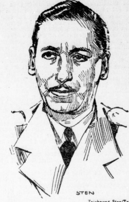
Willy Birgel spielt in dem V. Tourjansky-Film der Terra 'Der Gouverneur' einen General, einen inner verantwortungsbewußten Mann...