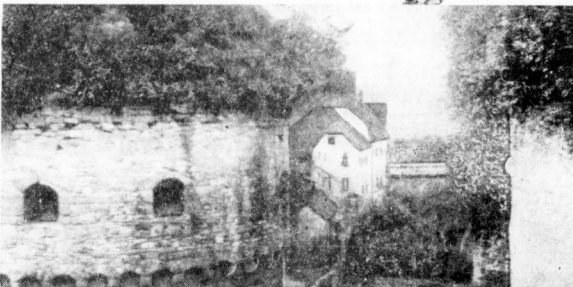
Die Bastionen der Burg Querfurt an der Quern.

Neuenburg bei Freyburg an der Unstrut