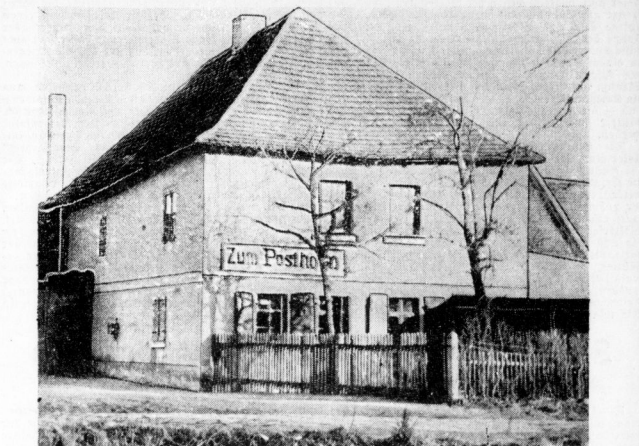
Das allehrwürdige Gasthaus „Zum Posthorn“.