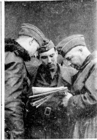
Einsatzbesprechung bei einer deutschen Jagdstaffel

Suifraum Seagorbe und Biser ein Luftkampf dem andern. Die neu auf 100 umgeleitete dritte Staffel konnte dabei an einem Tag zehn Abwürfe machen.