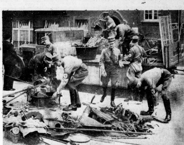
Aus allen Häusern holten die Männer der Bewegung das Alteisen ab.