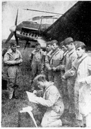
Zur Zeit führt die Luftwaffe im Gebiet um die Stadt Oldenburg große Manöwer durch...