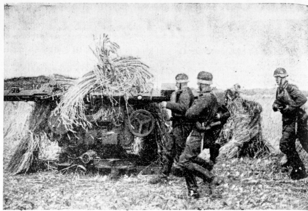
Die Besetzung des Kommandogerätes bezieht sich auf den Ruf des Flugleiters... (Caption for the military formation photo)