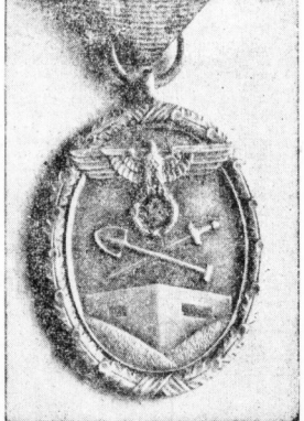
Der Führer hat durch Verordnung vom 2. August als Ausdruck seines Dankes und seiner Anerkennung für Verdienste um die Anlage und Errichtung des Deutschen Schutzwalles... (Caption for the artifact photo)