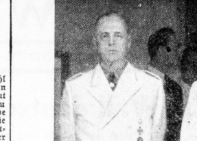
Während seiner Verhandlungen mit Reichsaussenminister v. Ribbentrop hatte der italienische Außenminister Graf Ciano auch zweimalig Aussprachen mit dem Führer aus dem Obersalzberg. Unser Bild zeigt den Führer, Reichsaussenminister v. Ribbentrop und Graf Ciano