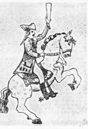
Altes Wirtshauschild: Der Alte Dessauer als Schutzpatron der Gose