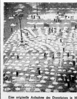
Eine originelle Aufnahme des Doppelplatzes in Mailand nach einem der letzten Schneefälle. Durch die Straßenreinigung wurde der Schnee auf dem weiten Platz zu kleinen Häufchen zusammengelegt.

Entdecken nicht immer bekannt kann. Erst 500 Jahre später wurde das Papier, das damals aus Baumrinde, Lumpen, Haut und Knochen hergestellt wurde, in Japan bekannt. In Zurland lernten die Araber die Kunst des Papiermachens, und zwar brachten ihnen diese Fertigkeit chinesische Seidenhändler mit. Im 12. Jahrhundert landete dann das Papier in Spanien, im 12. Jahrhundert in Italien auf. Die erste sicher besetzte deutsche Papiermühle ist die für Ilman Ztomer 1389 in Nürnberg erbaute Weismühle, wo am 22. Juni 1890 das erste Papier hergestellt wurde. Es folgte die Papiermühle zu Ravensburg, Weigand und Züder. Mit der Verbesserung der Fabrikationsweise und der Erfindung der Wasserkraft trat dann das Papier seinen Siegeszug durch die ganze Welt an und verdrängte allmählich das Pergament. In Tezila gelang übrigens die Entdeckung der ersten alten Papiermühle aus China, und zwar durch Professor August Gottlob des Kaisers von Sibirien. Sie reichten auf das Jahr 200 zurück.