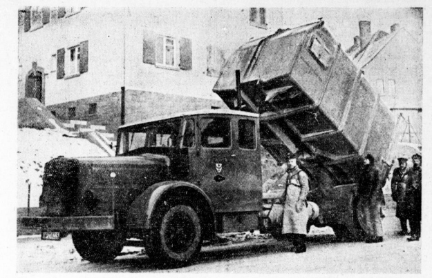
Einer der großen 12-Kubikmeter-Wagen der Städtischen Müllabfuhr.