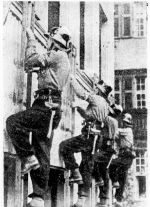
Auch die Hitler-Jugend will im Kampf um die Zukunft des deutschen Volkes nicht zurückstehen. So wurde verschiedentlich auch die HJ im Feuerwehrdienst ausgebildet. Die Jungen sind mit Freude und Begeisterung dabei. Hier sieht man sie beim Hakenleiter-Exerzieren am Kletterhaus.