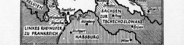
Der westliche Wunschraum: Ein in kleinere Staaten aufgeteiltes Deutschland. Unser Kartenbild zeigt ein zentralisiertes Deutschland, wie es als Kriegsziel von der britischen und französischen Hezgruppe verknüpft wird.

Das Blatt der Roten Armee, „Krasnaja Swesda“, veröffentlicht einen Artikel, der fast eine ganze Blattseite einnimmt unter der Überschrift: „Der Bankrott des Kriegesplans“.