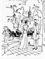
Dem Hof hatte sie ihm gelacht...