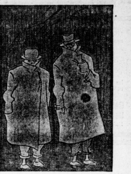
„Rein, diese Frauen, fast ledig hoch in schon hier und jetzt ist es schon bald ledig!“