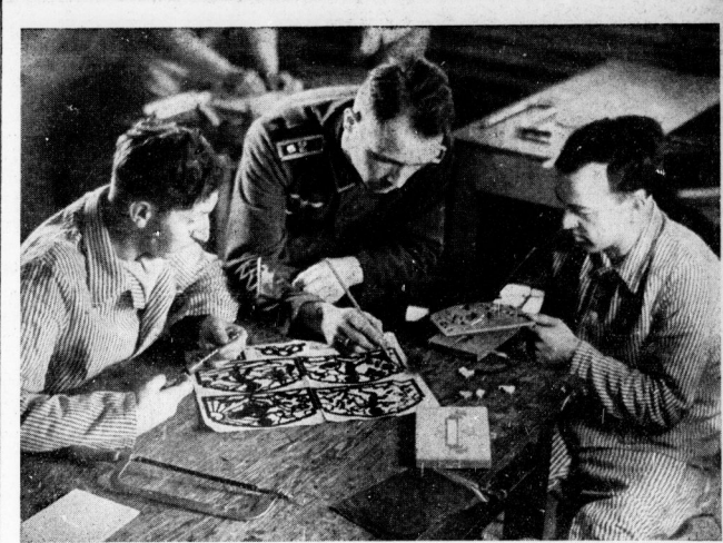
Das Volksbildungswerk stellt den Lazarett Lehrkräfte zur Verfügung, die die Verwundeten in Basterarbeiten unterrichten. Die Beschäftigten dient nicht nur dem Zeitvertrieb, sondern ist gleichzeitig auch eine Bewegungsbildung für Handverletzte. — Unser Bild zeigt Verwundete beim Anfertigen einer Ampel in Laubsägearbeit.

Diese Stunde hatte für sie beide eine besondere Bedeutung. Um sieben Uhr abends betrug ihn die Frau mit dem jungen Ingenieur, und um sieben Uhr lagte ihr der Freund, daß er sich mit ihrer Schwester verlobt habe. Und Tag für Tag erwiderte sie dieser kühnen Bescheidene ihren größten Entschluß und Schicksal. Tag für Tag erinnerte sie sich an das Unglück ihres Lebens und schworen sich mit stillen Händen ewige Treue und Verbundenheit.