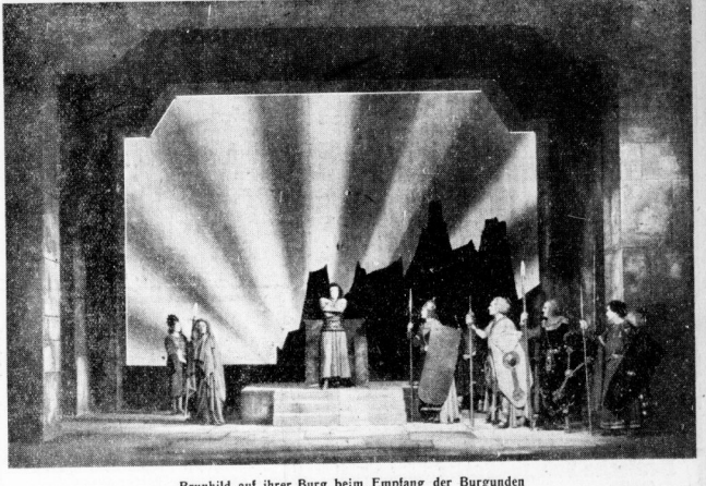
Brunhild auf ihrer Burg beim Empfang der Burgunden. Szenenbild aus der Wiederaufführung von Hebbels 'Nibelungen' im hallischen Stadttheater.