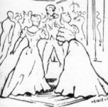
Entlassen Sie mich, meine Damen!