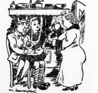
„Sei nicht böse zu Jean, Mama - es ist sein erster Sieg in diesem Krieg!“

„Ganove“ oder besserer Herr? Hans Albers in dem neuen Tobis-Film „Ein Mann auf Abwegen“.