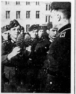
Die Kompanie ist zum Stiehellappell angetreten. Regelmäßig überzeugt sich der Hauptfeldwebel, daß die Stiehell Kompanie tadellos gepflegt sind. Sind die Stiehell appellfähig, dann wird der Soldat bei jedem Wetter trockene Füße haben.