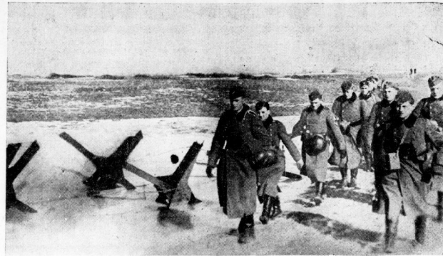
Beim Vorgehen zum feindlichen Gebiet haben hier die Soldaten eines Stoßtrupps einen Waldrand erreicht, vor dem noch eine Tanksperrung liegt. Da sie noch in guter Deckung sind, können sie sich frei bewegen, bald aber sind sie im Niemandsland.

Aber seine Vision war falsch gewesen. Er starb nicht. Die Wästel und Bot brachten seine Verwandten so viel Geld zusammen, daß man ihn im Jahre 1910 über Sibirien nach Zambinowien schaffen konnte. Nach Ende des Krieges tauchte er dann in Paris auf, wo er allerdings in der russischen Emigration keine Rolle mehr spielen konnte und verlor man sich. Er kam einmal auf der Straße einem alten russischen Freund den nahen Tod anlagte. Seine angebliche geheimnisvolle Tätigkeit des zweiten Geistes hatte ihn anscheinend nicht verlassen. Aber es gibt Leute, die behaupten, Graf Karasnowitsch habe nur einfach einen guten Willen für den Wohlwollensguten anderer Menschen gehabt und sich die letzten 24 Stunden des zweiten Geistes nur vor der Zeit vor 20 Jahren die unheimlichen Gerüchte in Petersburg. Anfang dieses Jahres ist der Graf einsam und verlassen gestorben.