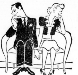
„Was müde gefahren, wenn ich Sie jetzt hätte, träumen Sie?“ „Sie würden so viele Dörstigen bekommen, wie Sie mir küßeln.“ „Einfachheit“, sagte der junge Mann, „aber mer toll anfangen.“