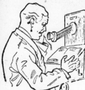
„Ein Menschenleben ist in Gefahr“