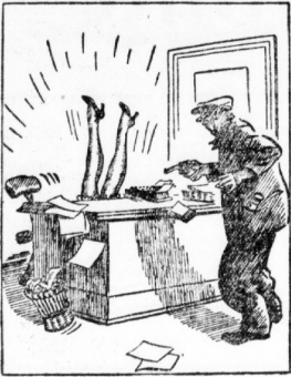
„Ich hatte zwar gesagt: Hände hoch! Fräulein, aber es wird auch so gehen!“

beraus. Stellen wir ihn mal zu Rate. Mich interessiert das. Er setzte dem Gärtner, der freundlich läufte, seine Pfeife. Der lächelte nur. Und dann fragte der Professor, wann er, der Gärtner, seine Pfeife geplatzt hätte, ob bei zu oder abnehmendem Mond? Der Gärtner beteuerte, daß er darauf nicht geachtet habe. Er hätte dem Vorden zwei Bogen Bieremüß gegeben, „Denn“, so fügte er hinzu, „ich bin der Meinung, daß die Pfeife im Wadenbruch und daß immer der Mond im der Erde bedeutend näher liegt als der Mond am Himmel.“