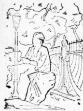
„Robbehol“ rief sie mit bunter Stimme