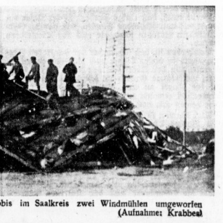
Vor einigen Tagen wurden durch eine Bö bei Dobis im Saalkreis zwei Windmühlen umgeworfen und völlig zerstört.