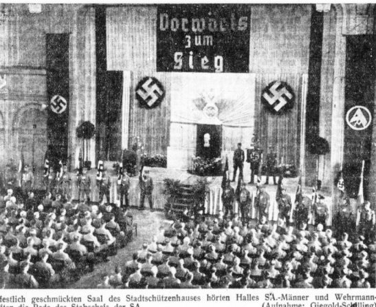
Im festlich geschmückten Saal des Stadtschützenhauses hörten Halles SA-Männer und Wehrmannschaften die Rede des Stabschefs der SA.

Feierlicher Gemeinschaftsempfang der Rede des Stabschefs der SA. Luge