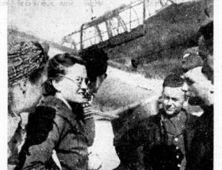
Junge Norwegerin auf der Skifahrt im Gespräch mit deutschen Fliegern, die einer Flughafen besetzt haben.