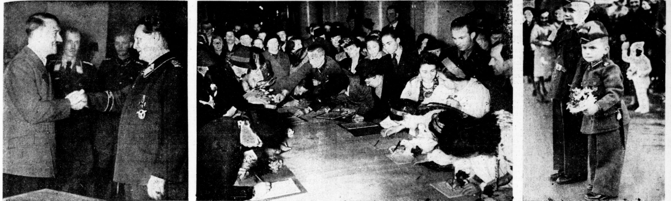
Der Geburtstag des Führers. Links: Der Führer dankt Generalfeldmarschall Hermann Göring, der ihm zugleich mit den Glückwünschen zum Geburtstag die Mitteilung von der überwältigenden Metallspende überbrachte. — Mitte: Seit den frühen Morgenstunden des 20. April kamen unzählige Volksgenossen zur Reichskanzlei, um sich in die Glückwunschlisten für den Führer einzutragen. — Rechts: Zwei kleine Gratalanten... vor der Reichskanzlei.