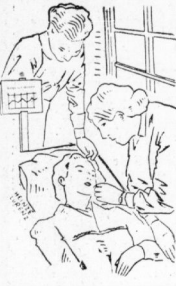
Agnes saß in der Birnbaumtrube alle in Entziden

Der nur aus wenigen, vertriebenen Säulen mit Werten bestand. Auf einer Anhöhe lag eines inmitten eines bodenunmännlichen Gartens.