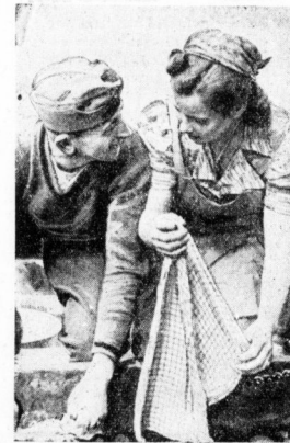
So macht auch große Wasche Spaß. Eine idyllische Szene hinter dem Westwall.