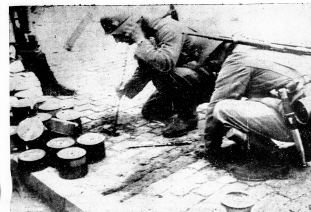
Zu den gefährlichen Hindernissen, die unsere Feinde dem Vormarsch der deutschen Truppen in den Weg legen, gehören auch die Minensperren. Unser Bild zeigt deutsche Soldaten, die unter dem Plaster in den Straßen von Brüssel nach versteckten Minen suchen.