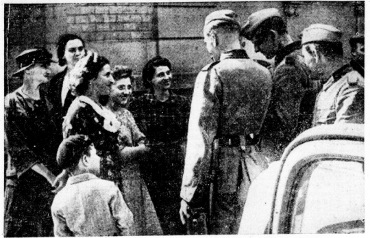
Herzliche Unterhaltung zwischen deutschen Soldaten und Elsässern... Nach der Besetzung von Mühlhausen in Elsaß entspann sich zwischen der dort verbliebenen deutschen Bevölkerung und unseren Soldaten ein herzliches Verhältnis.

„Nicht frei aber von Bitterkeit und Trauer um