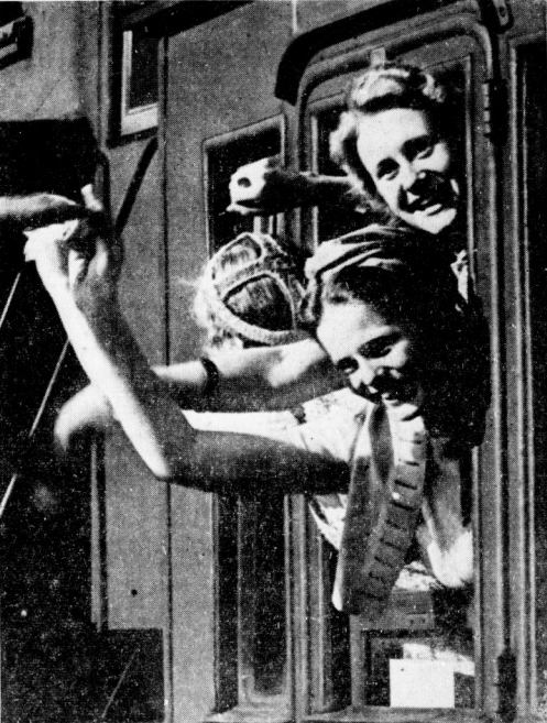
Frohe Fahrt zur Erntehilfe