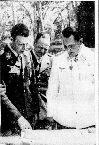
Reichsmarschall Hermann Göring Unser Bild zeigt den Oberbefehlshaber der Luftwaffe bei einer Besprechung mit Generaloberst Luff und Major Wittig in seinem Hauptquartier.

Es liegt nun im Interesse eines Siegers, die ihm möglichen Bestimmungen als für alle heilig hinzustellen, im Wesen des Selbstbehaltungsprinzips des Völkerrechts aber, für die allgemeinen Menschenrechte wieder zurückzuführen. Nur im Falle des Faltens eines übermächtigen Gegners um zu weiterer Vorgehensart, als dieser Gegner damals kein christlicher Sieger war.