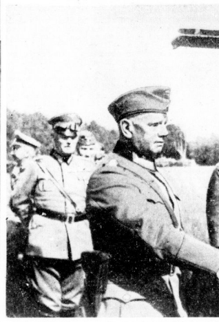
Vom Führerhauptquartier aus begab sich der Führer im Flugzeug mehrmals zu seinen Soldaten in die vordersten Stellungen des Operationsgebietes. - Nach der Landung nach einem solchen Frontflug begrüßt der Führer, wie unser Bild zeigt, den General der Artillerie von Reichenau.

Daher war der britisch-französischen Anspruch, das Versailler Traktat als eine Art internationale oder auch höhere Rechtsordnung anzusehen, für jeden europäischen Deutschen nichts anderes als eine freche Annahme, die Annahme aber, daß ausgerechnet englische oder französische Staatsmänner Hüter des