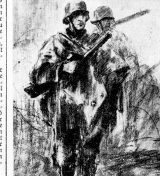
Nicht die Überlegenheit der Waffen, sondern der überlegene Kampfesgeist des deutschen Frontsoldaten hat den Sieg errungen.

Am 6. Oktober 1939 sprach ich von dieser Stelle aus zum zweitenmal im Krieg zum deutschen Volk. Ich konnte nicht die militärisch glänzende Niederwertung des politischen Zitates mehr, ich habe damals angestrebt einen Appell an die Einsicht der verantwortlichen Männer in den leidenden Staaten gerichtet und an die Völker selbst. Ich war nie vor einer Weiterführung des Krieges, der Völkern nur schmerzhaft sein konnten. Ich war, besonders die Franzosen, einen Kampf zu beginnen, der zwingend die Grenze ihres Völkern weiterschritt und, ganz gleich, wie sein Ausgang sein würde, in ihren Folgen fürchterlich wäre. Ich habe diesen Appell damals auch an die britische Welt gerichtet, allerdings - wie ich es ausprüchlich mit dem Bewußtsein, nicht nur nicht gehört zu werden, sondern damit wahrheitsgemäß erst recht den Grimm der internationalen Kriegsheker zu erregen. Es ist auch genau so gekommen. Die verantwortlichen Elemente in England und Frankreich haben in diesem meinem Appell einen gefährlichen Anstoß gegen die Kriegsgeschichte gesehen. Sie schickten sich daher sofort an zu erklären, daß jeder Gedanke an eine Verständigung auszuscheiden sei, ja, als ein Verbrechen gewertet wurde, daß der Krieg, weitergeführt werden müßte im Namen der Kultur, der Menschlichkeit, des Glüdes, des Fortschritts, der Zivilisation