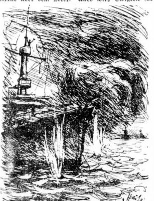
Gorch Fock signalisierte dennoch...

ist es nicht schade, dachste sie, ohne ihn anzusehen, daß wir hier beide unseren Weg gehen, einzeln, wohlgezogen und lächerlich. Wir könnten gemeinsam unsere Zeit hier verbringen, die See betrachten, an der Meeresküste entlang wandern..."