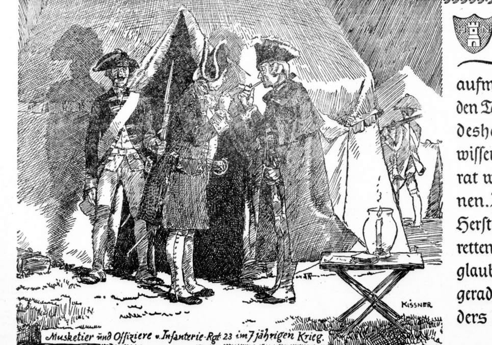
Muskettier und Offiziere »Infanterie-Regt 23 im 7-jährigen Krieg.

Die Mitteldeutsche Börse hat am 22. Juli einen Aufwärtstrend gezeigt. Die Kurse für Aktien und Anleihen sind gestiegen. Dies ist auf die positive Stimmung in der Wirtschaft zurückzuführen, die durch die Kriegsausgaben verursacht wurde. Die Börse hat sich von den Schwankungen der letzten Tage erholte und zeigt nun einen klaren Aufwärtstrend. Die Kurse für Aktien sind besonders stark gestiegen, was auf eine positive Bewertung der deutschen Wirtschaft hindeutet. Die Kurse für Anleihen sind ebenfalls gestiegen, was auf eine positive Bewertung der deutschen Staatsfinanzen hindeutet. Die Börse wird voraussichtlich in den nächsten Tagen weiter aufwärts tendieren.