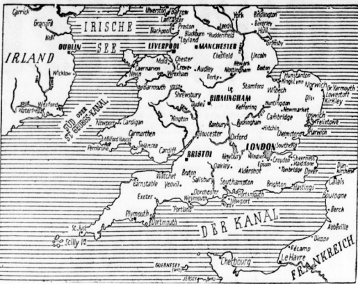
Lagekarte von England zum OKW-Bericht. Gezeichnet nach dem Stande vom Donnerstag.

Erlebter gemessen sei, Verhöhnung damit die Vereinigten Staaten aufgeföhrt, an die sie sich... Der deutsche Wehrmachtbericht