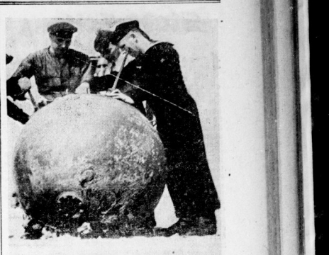
Die allen Regeln des Völkerrechts hohnsprechende britische Seeblockade zeigt zu immer brutaleren Methoden über. Hierzu zählt auch das Legen von Treibminen, die eine furchtbare Gefahr für die Schifffahrt bilden und auf die in der amtlichen deutschen Note zur totalen Blockade besonders hingewiesen wurde...