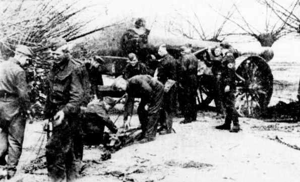
Zu den Bergungsarbeiten des feindlichen Beute- und Strandgutes an der künstlichen Sunnpküste...