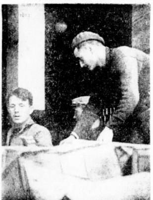
Die in Narvik gefangenen Engländer sind jetzt wieder bei ihrem auf der Flucht zurückgelassenen Kriegsmaterial eingetroffen...