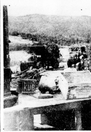
Die Straße des Rückzuges