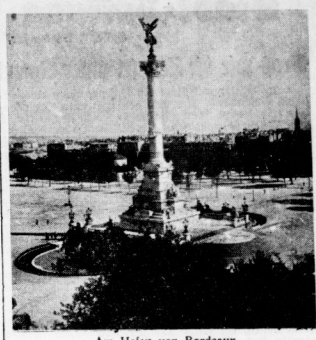
Am Hafen von Bordeaux