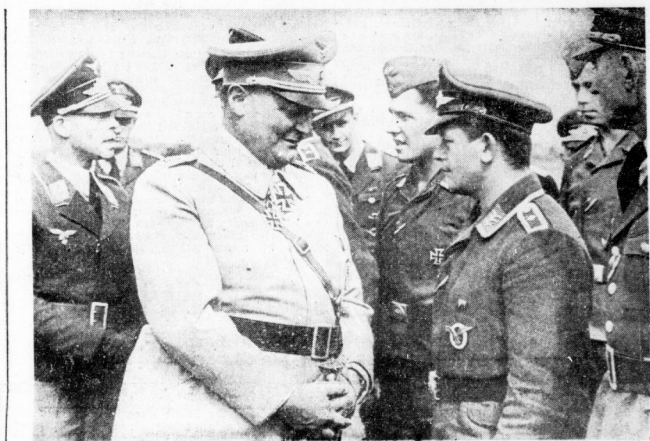
Der Reichsmarschall Hermann Göring leitet persönlich den Großeinmarsch der Luftwaffe gegen England. Unser Bild zeigt den Reichsmarschall, der den Bericht einer soeben vom Feindflug zurückgekehrten Flugzeugbesatzung entgegennimmt.

Langsam sinkt die Wahrheit durch. Es gelingt der britischen Propaganda nicht, die Erzähl-