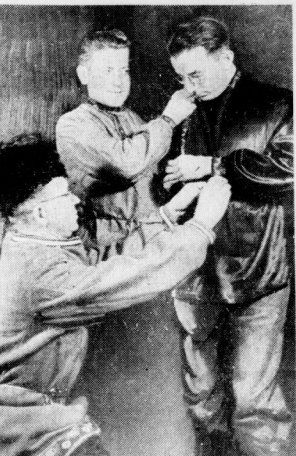
Soldaten bei der Verwandlung in „Balalaika-Russen“