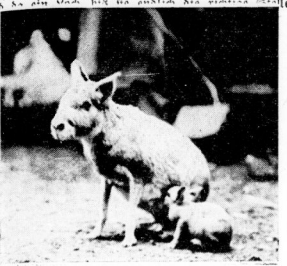
Familienfreuden bei Maras.