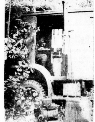
Bei unseren Nachrichtentruppen Die moderne deutsche Kriegführung ist ohne Nachrichtenstruppen undenkbar.

geben, den feindlichen Gegenstand rechtzeitig abfangen und zum Scheitern zu bringen.“