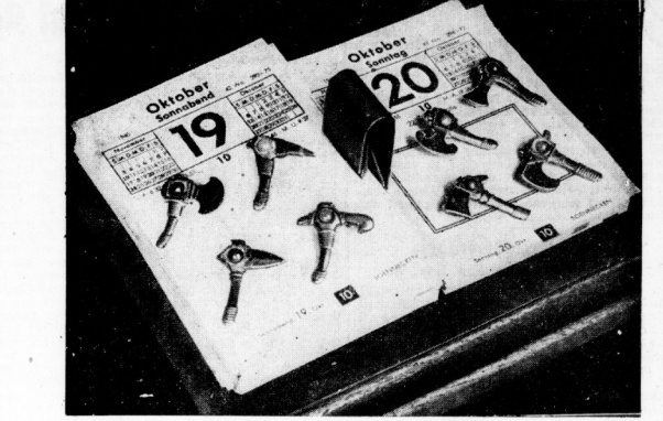
Acht Streifeakte im Kampf für das Kriegs-WHW. Am 19. und 20. Oktober findet die 2. Reichsstraßensammlung für das Kriegs-WHW statt.

Wenn nun zu allen Tageszeiten die deutschen Nachrichten über den Kanal fliegen, um den eisernen Vorhang über dem Angriff voranzutragen“