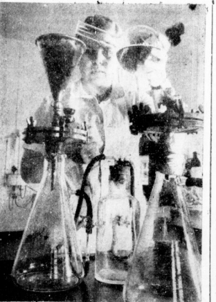
Serum-Filtration in den Marburger Behring-Werken

faunt. Die Zahl der auf diese Weise erkrankten Kinder wuchs rasch. Behring unermüdlich Fortschritte hat aber noch eine andere Arbeit erbracht: er hat die Diphtherie und des Tetanus (Wundstarrkrampf) Mitarbeiter in Marburg und in Trier, die sich der Bekämpfung der Diphtherie und des Tetanus (Wundstarrkrampf) gewidmet waren, so einfach und leicht seine Gedanken waren, so schwierig war es, ein einziges aller Versuche in die ärztliche Praxis einzuführen. Das es trotzdem in vollen Umfang möglich geworden ist, muß ebenfalls als ein Verdienst dieses unermüdlichen Forschers gewertet werden.