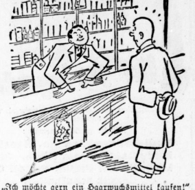
„Ich möchte gern ein Daarwaßmittel kaufen.“ „Gewiß, mein Herr, das ist eine große oder eine kleine Rinde.“

Wendelhosen - H. Nehab N. Große Ulrichstr. 8