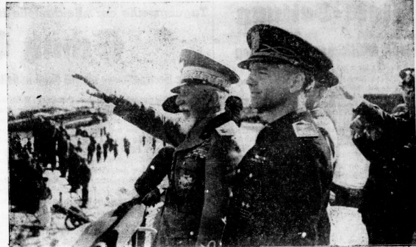
Marschall de Bono in Spanien. Marschall de Bono weilt in diesen Tagen in Spanien, wo er von Staatschef Franco empfangen wurde. Unsere Aufnahme zeigt Marschall de Bono auf dem Flughafen in Madrid, wo er mit dem spanischen Innenminister Serrano Suner den Vorbesuch spanischer Falange abnahm.