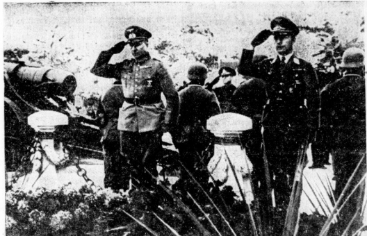
Die deutsche Militärmission in Bukarest. Unser Bild berichtet von der leiterlichen Kranzgliederung der Mission am Grabmal des Unbekannten Soldaten...