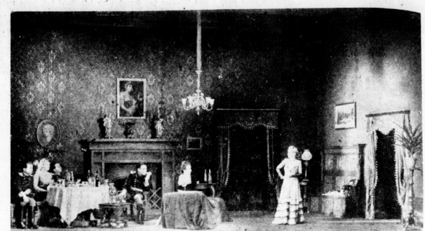
„Die Liebe der Anna Nikolaewna“