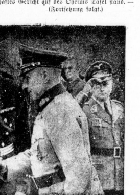
Die Begrüßung der deutschen Militärmission in Bakarest