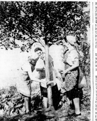
Auch Schlingensackekämpfung will gelernt sein (Aunahme: Giegold-Schilling)

Schulung der Untergaubauftragten des VDM-Werkes „Glaube und Schönheit“