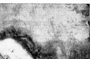
Teilstück des Isenheimer Altars: die Mutter Maria mit dem Kinde

Der Isenheimer Altar von Matthias Grünewald, das größte deutsche Kunstwerk im Glas, ist jetzt, wie bekannt wurde, zurückgekehrt. Der Altar wurde im Jahre 1824 in die Schweiz gebracht und ist jetzt in die Heimat zurückgekehrt. Der Altar wurde im Jahre 1824 in die Schweiz gebracht und ist jetzt in die Heimat zurückgekehrt.