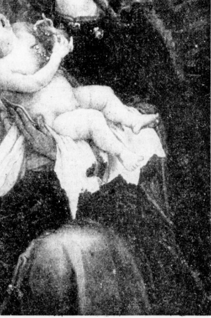
Teilstück des Isenheimer Altars: die Mutter Maria mit dem Kinde

Der Isenheimer Altar von Matthias Grünewald, das größte deutsche Kunstwerk im Glas, ist jetzt, wie bekannt wurde, zurückgekehrt. Der Altar wurde im Jahre 1824 in die Schweiz gebracht und ist jetzt in die Heimat zurückgekehrt. Der Altar wurde im Jahre 1824 in die Schweiz gebracht und ist jetzt in die Heimat zurückgekehrt.