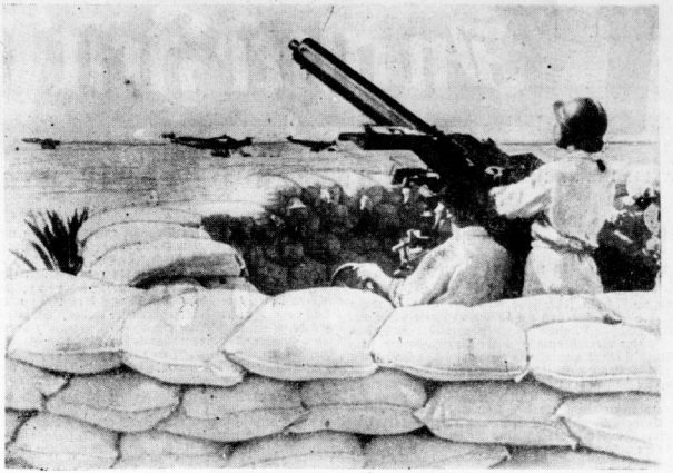
Italienische Flak am Wasserflugzeughafen. Die zahlreichen italienischen Flak für Wasserflugzeuge besitzen einen umfangreichen Schutz gegen feindliche Luftangriffe. Unser Bild zeigt einen MG-Stand in einem italienischen Wasserflugzeughafen

Der Penote-Gotteshied wird gewöhnlich nachts in einem dafür hergerichteten Zelt abgehalten, in dem auf einem halbkreisförmigen, sechs Zentimeter hohen Schemel eine Penote-Pflanze aufsteht. In dieser Zeit sitzen die Teilnehmer nach Belieben Penote-Blumen Tabakrollen mit ihnen ein Geschäft von Glas und Frieden erzeugt werden, manchmal stellen sich auch Erbrechen und Schweißausbrüche ein. Die Teilnehmer sind bis Tagesanbruch da und nach dem Aufbruch des Tages wird ein Gebet gesprochen, es werde die glücklichen Tage der Vorzeit wiederkehren, es werde die Welt im Überflutungsstand sein und die Indianer würden sich wieder des vollen Reichtums der Welt erfreuen. Dieser Gebetsritus wird in einem Stamm zu Stamm, er wurde im Norden und im Süden angenommen und in einem Weltkreis herumgeführt. Nach dem Essen der Teilnehmer bilden sich über die Gebirge wie schwarze Wolken, die sich über den Himmel ausbreiten und fortwährend den Himmel überdecken. Nach dem Essen tritt eine Frau in den Kreis, die die Hände gegen Nordwesten und spricht nehmend ein inbrünstiges Gebet um das Kommen des indischen Christus. Dieser Geist führt sich überflutet zu haben; der Weltkreis wird nur noch selten getauscht.