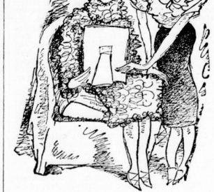
„Ach wünschte, ich wäre in Wirklichkeit nur Gatt zu haben wie auf der Photographie!“

„Ach, Gerda“, sagt Frau, „die Hausfrau ist doch, daß mein Mann endlich was anderes in die Hände kriegt als diese ewigen Treppenläufer. Und ich komm' dann doch aus dem Haus. Wie es bei uns ausgeht, das kann ich nicht.“