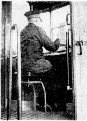
Der Fahrer auf seinem Sitz

In der frühen Mittagsstunde des gestrigen Tages errege ein fröhliches neues Zufahren bei seiner Probefahrt durch verschiedene hallische Straßen allgemeines Aufsehen. Es handelt sich hierbei, wie gelte schon früh berichtet, um den neuen Erriebwagen der Straßenbahn Halle, der von der Firma Gottfried Günther Kammendorf im Auftrag der Werke der Stadt Halle fertig entwickelt worden ist. Dieser Erriebwagen ist mit 4. 2. umwälzenden Neuerungen in der Bauart und mit den modernsten Signalrichtungen versehen; er bietet den Fahrgästen sowie dem Bedienungspersonal weitgehende Bequemlichkeiten und ist ebenso schnell wie betriebssicher. Wenn in etwa 14 Tagen die Abnahme vorgenommen sein wird, werden die Gassen sich von den Vorzügen des neuen Erriebwagens selbst überzeugen können, der nachher auf allen Linien zum Einsatz kommen soll. Als weitere bemerkenswerte Neuerung ist für das Jahr 1942 der Motorwagen mit „Oberleitungs-Omnibussen“ in Halle zu erwarten, die ihr ihren Antrieb das Verdrahtungssystem, jedoch nicht an die Straße gebunden sind.