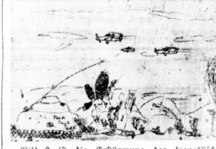
Bild 2 ist die Erstürmung der französischen Dunfer.