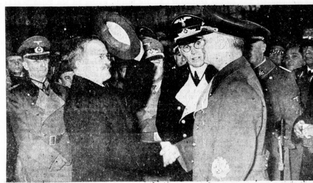
Präsident Molotow wieder nach Moskau abgereist. Unser Bild zeigt, wie sich Präsident Molotow vom Reichsminister des Auswärtigen von Ribbentrop verabschiedet.

Abn. Berlin, 15. November. In der vergangenen Nacht ist die Luftabwehr des Reiches durch einen Angriff auf die britischen Rüstungswerke in Mittelengland erfolgreich. Acht Feindflugzeuge wurden abgeschossen, vier weitere schwer beschädigt. Die Angriffsflotte bestand aus vier Bombern, die in der Gegend von London abgewehrt wurden. Die verbleibenden vier Flugzeuge wurden durch die Luftabwehr in der Gegend von London abgeschossen. Die Angriffsflotte bestand aus vier Bombern, die in der Gegend von London abgewehrt wurden. Die verbleibenden vier Flugzeuge wurden durch die Luftabwehr in der Gegend von London abgeschossen.