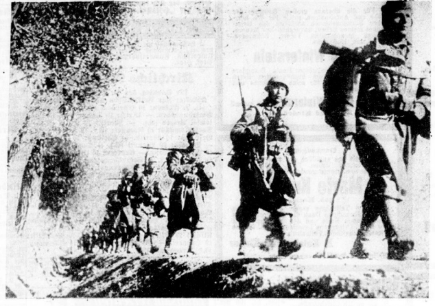
Italienische Truppen auf dem Vormarsch zur vordersten Linie in Griechenland