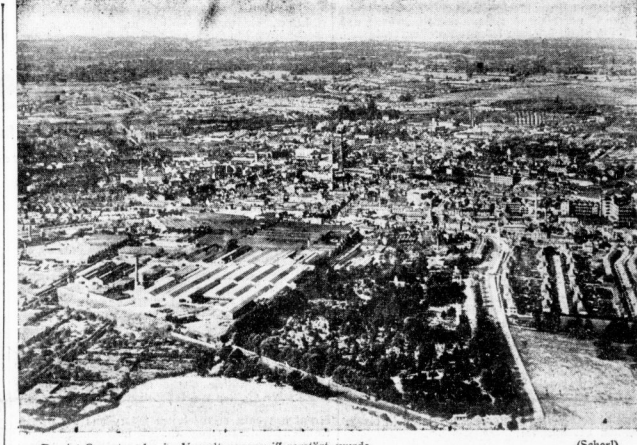
Das ist Coventry, das im Vergeltungsangriff zerstört wurde

Nach Bericht der einzelnen Geschäftsbereichsleiter wurde zum Reichsbergratskommissionar Walter das Wort, um zu den Männern der D.R.G. zu sprechen. Er kennzeichnete die entscheidende Bedeutung, die dem Reichsbergratskommissionar als dem ersten Mann der D.R.G. politisch und militärisch nach der Ausrichtung Englands zugefallen ist. Nach mehr als dieser Rede damit der deutsche Bergmann an der vorderen Front der schaffenden Deutung. Es werde immer vom deutschen Bergmann und seiner Leistungsfähigkeit und Leistungsfähigkeit abhängen, ob die deutsche Kohle den Anforderungen, die nun von ganz Europa an die Kohle gestellt werden, gerecht werden kann. Der Reichsbergratskommissionar zeichnete die deutsche Kohlenverfügung aus und hob hervor, dass wir allen Anforderungen trotz der nun einmal fehlenden Kohlen im Reichsbereich der Kohlenverfügung vorüberhanden Schwierigkeiten jetzt und in immer härteren Maße gewachsen sein würden. Er unterstrich besonders die Notwendigkeit der Einführung einer gefundenen Anordnung im Koh-