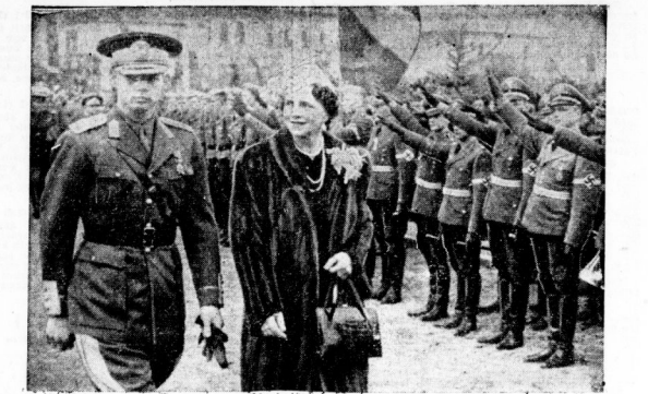
König Michael und Königinmutter Helena bei den Feiern in Jassy