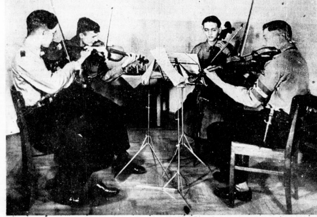
Quartett der Hitler-Jugend

Musikfreudigkeit, gefördert durch das Vorbild der Orchester-Angehörigen