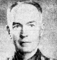
General Antonescu.